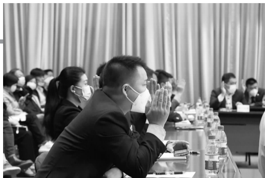
与会代表就提名名单进行举手表决