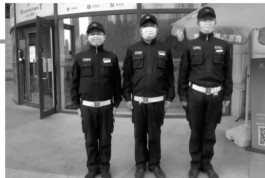
物业人员参与重大活动期间安保工作