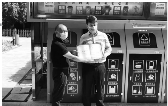
为外企公寓小区颁发“垃圾分类示范小区”证书