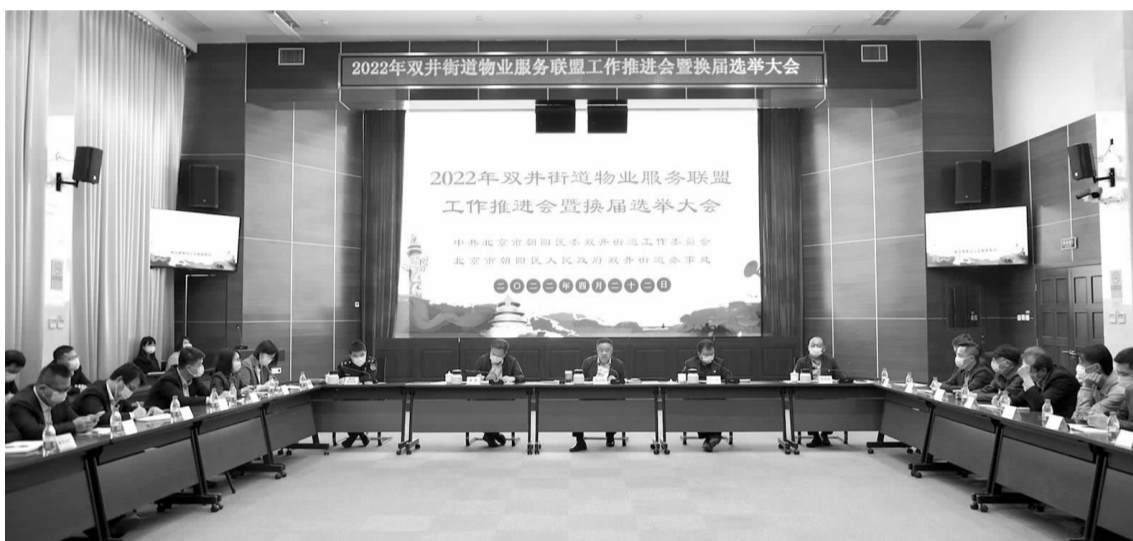
街道召开 2022 年物业服务联盟工作推进会